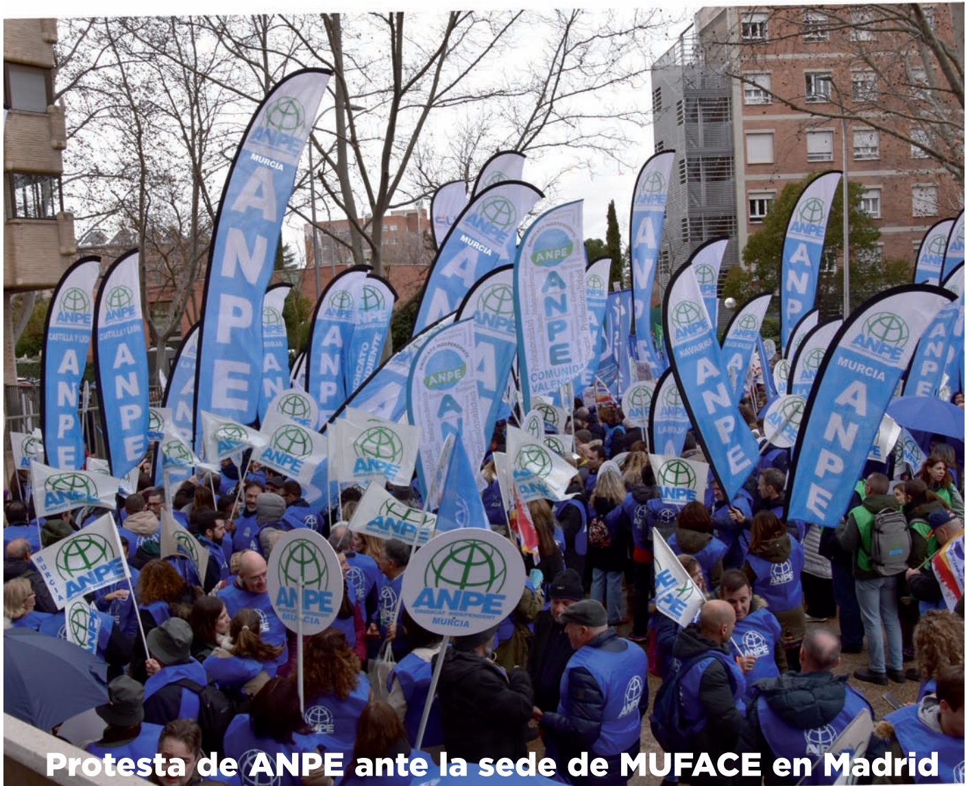
Protesta de ANPE ante la sede de MUFACE en Madrid